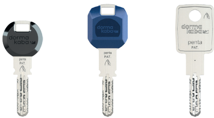
Standardschlüssel (Clip in schwarz)