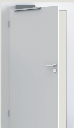
2. Montering på overkarm i hængselside