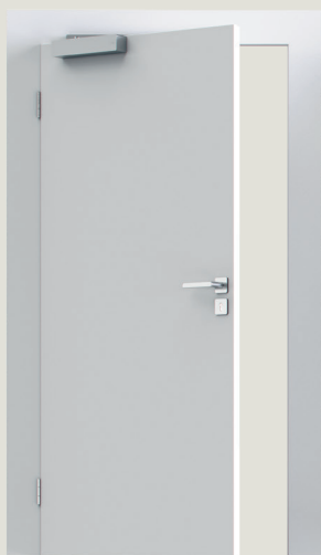
1. Montering på dørblad i hængselside