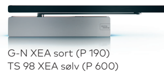
G-N XEA sort (P 190) TS 98 XEA sølv (P 600)