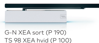
G-N XEA sort (P 190) TS 98 XEA hvid (P 100)