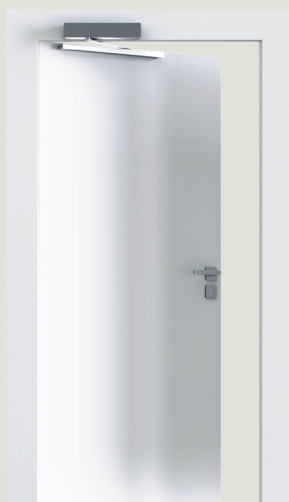
3. Montering på overkarm modsat hængselside