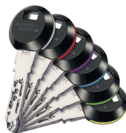
En los clips transpondedores RFID , los elementos circulares de 6 colores facilitan la orientación.