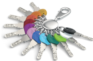
Para la llave estándar hay clips Smartkey en 12 colores.