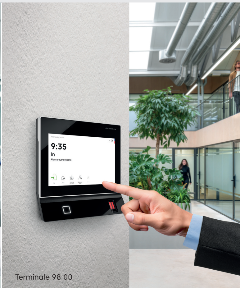
Terminale 98 00

Come opzione, i terminali possono essere utilizzati per il controllo delle porte o come terminale con aggiornamento CardLink/AoC per la propria soluzione di accesso. La telecamera può anche leggere i codici QR e utilizzarli per concedere i diritti di accesso.