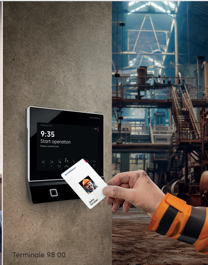
Terminale 98 00