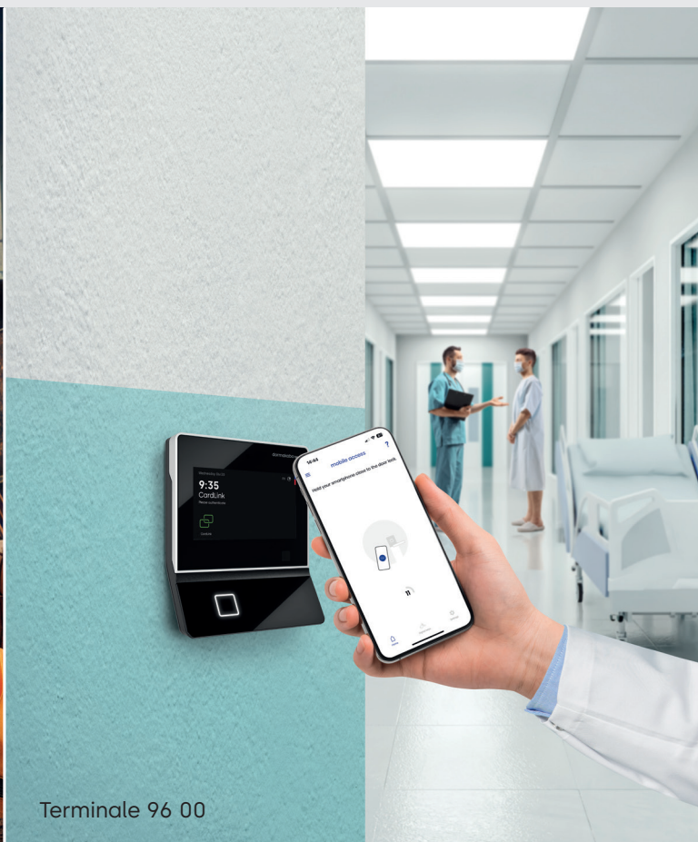
Terminale 96 00