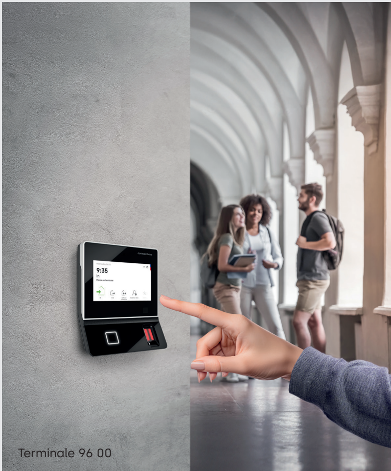
Terminale 96 00

Gli affidabili terminali dormakaba offrono una facile registrazione elettronica degli orari, il controllo degli accessi e la raccolta dati di produzione.