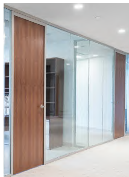
Le système de châssis UNIQUIN convient à la fois aux pièces où une transparence totale est souhaitée et aux solutions de portes individuelles. Il existe plusieurs déclinaisons : le bois, par exemple, peut présenter un intérêt visuel et offrir une certaine discrétion si nécessaire.

Les salles de conférence doivent favoriser la concentration et la créativité, et la transparence ne doit pas être un obstacle à cet égard. Une pièce ouverte avec une bonne luminosité naturelle et une vue panoramique crée une atmosphère agréable et