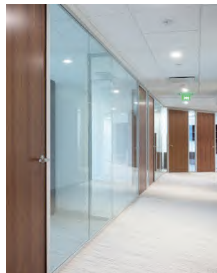
Transparence : Les pièces créées avec UNIQUIN sont lumineuses et conviviales.

Les espaces de bureau bénéficient d'un environnement sain et propice à la communication grâce aux cloisons vitrées UNIQUIN qui, combinées à un design attrayant, créent des espaces ouverts et stimulants. UNIQUIN permet une bonne isolation acoustique