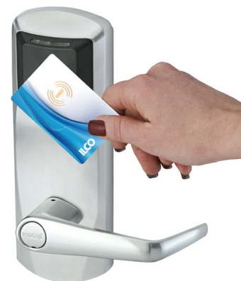
Serrure 790 RFID avec carte