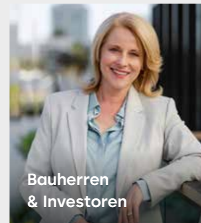
Bauherren & Investoren

Ob Investor, Gebäudebesitzer, -betreiber oder Architekt und Planer – MotionIQ zahlt sich für alle aus.