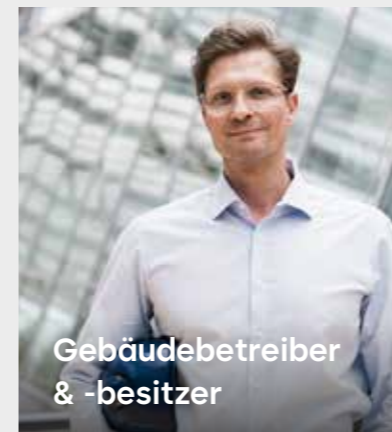
Gebäudebetreiber & -besitzer