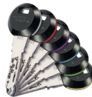
De RFID transponder clips kunnen met 6 gekleurde ringen worden uitgevoerd voor gemakkelijke herkenning