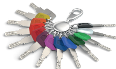
Sleutels met grote sleutelclip zijn in 6 verschillende kleuren verkrijgbaar