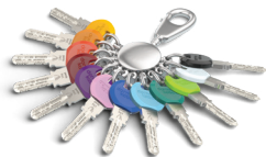
Smartkey clips zijn voor standaard sleutels in 12 kleuren verkrijgbaar