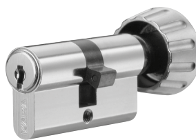
Wkładka z pokrętką