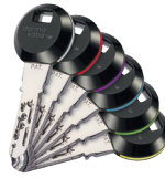
De RFID transponder clips kunnen met 6 gekleurde ringen worden uitgevoerd voor gemakkelijke herkenning