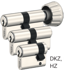
DKZ, DZ en HZ