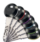
Sur les clips à transpondeur RFID, 6 éléments circulaires colorés facilitent la reconnaissance.