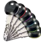
Sur les clips à transpondeur RFID, 6 éléments circulaires colorés facilitent la reconnaissance.