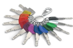
La clé avec clip Largekey est disponible en 12 couleurs.