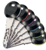
Sur les clips à transpondeur RFID, 6 éléments circulaires colorés facilitent la reconnaissance.