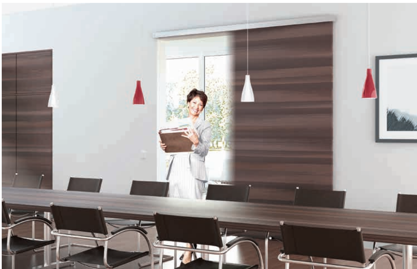
Automatické posuvné dveře CS 80 MAGNEO – zde jsou montovány dveře s dřevěnými křídly u konferenční místnosti.

„Když máme zcela plné ruce, jsou automatické dveře obrovským ulehčením.“