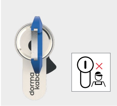
Schlüsselkanal in der normalen Stellung: 6 Uhr

In der Service-Position (8 Uhr) kann der Schliesszylinder von außen und innen mit dem Service-Schlüssel und Inhaber-Schlüssel auf- und zugeschlossen werden. Die Schlüssel-Abzugsposition kann mit dem Service-Schlüssel nicht verändert werden.