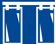
Interior Glass Systems