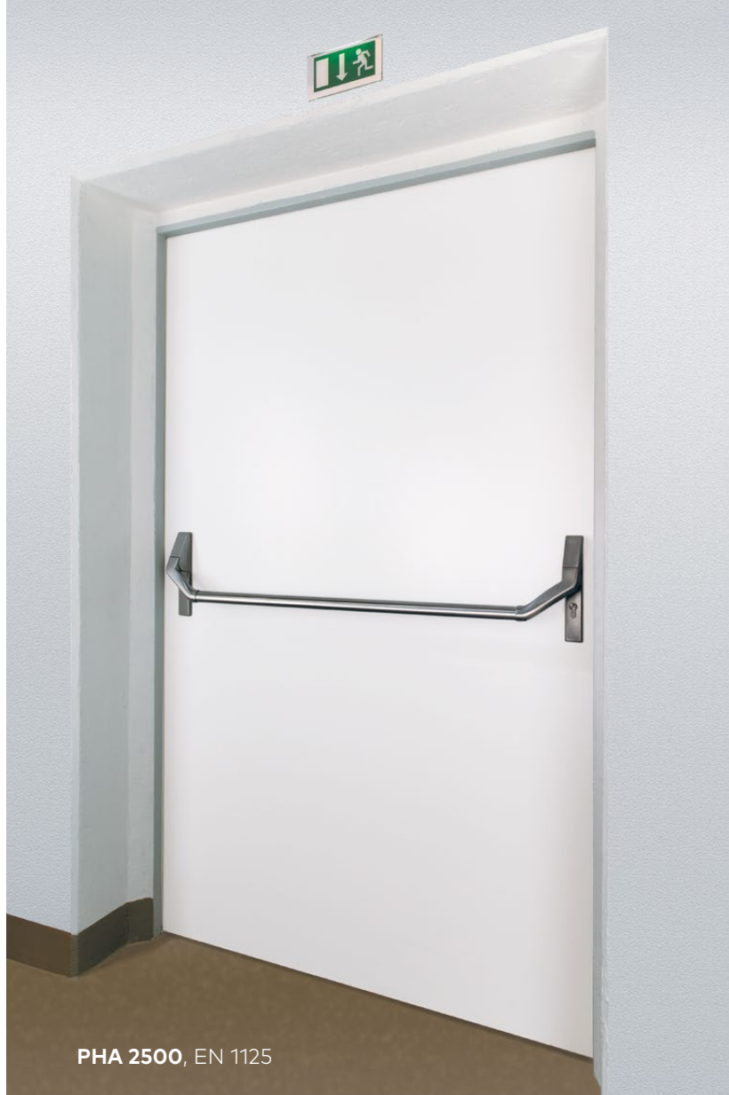
PHA 2500, EN 1125

Kontakta din dormakaba- representant eller läs mer på www.dormakaba.se