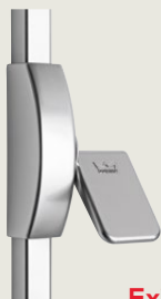
Exit pad, EN 179

dormakaba Exit Pad är enkel och bekväm att öppna eftersom den är installerad på dörrbladet och regeln hakar fast i ett slutbleck på dörrkarmen.