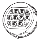
3750-K Dispositivo di forma rotonda