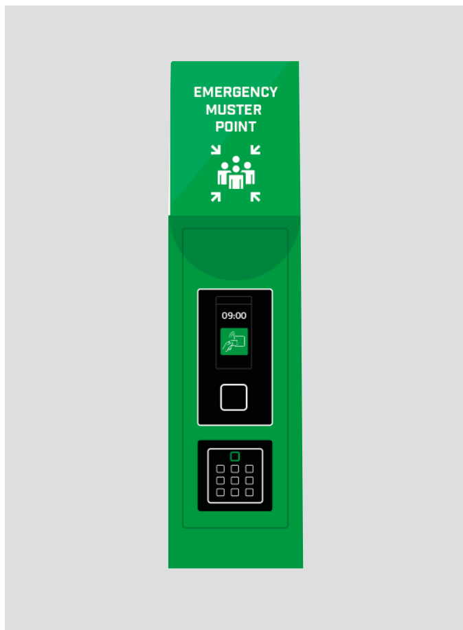
Colonna punto di raccolta Life-Safety