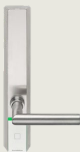
c-lever E310 med TouchGo-funktion og RFID

TouchGo-funktionen spiller naturligt sammen med bygningens eksisterende sikkerhedsforanstaltninger. Dit system forbliver dermed mindst lige så sikkert som før. TouchGo er et tilvalg til evolo serien og tjener sig hurtigt hjem i kraft af øget komfort og sparet tid.