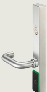
c-lever, jossa TouchGo ja RFID-toiminto

Järjestelmä vastaa moniin toiveisiin myös turvallisuuden kannalta, sillä TouchGo-toiminnolla varustettu c-lever on integroitavissa olemassa oleviin -turvallisuusratkaisuihin. Järjestelmäsi säilyy yhtä turvallisena kuin se on ollut tähänkin asti: TouchGo lisää käyttömukavuutta ja takaa parhaan mahdollisen suojan investoinnillesi.