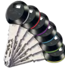
Sur les clips à transpondeur RFID, 6 éléments circulaires colorés facilitent la reconnaissance.