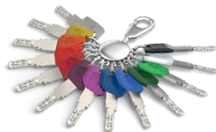
La clé avec clip Largekey est disponible en 12 couleurs.