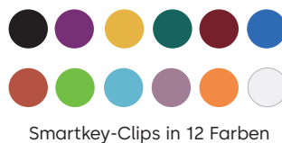
Smartkey-Clips in 12 Farben