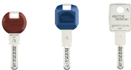
Standardschlüssel (Clip in schwarz)

Dank des Patentschutzes ist der Kopierschutz gewährleistet, da nur Schlüssel mit exakt ausgeführter Blockgeometrie in den Schließzylinder angesetzt werden können.