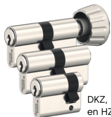
DKZ, DZ en HZ