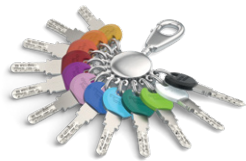
Smartkey clips zijn voor standaard sleutels in 12 kleuren verkrijgbaar