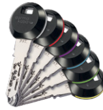
De RFID transponder clips kunnen met 6 gekleurde ringen worden uitgevoerd voor gemakkelijke herkenning