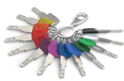
Sleutels met grote sleutelclip zijn ook in 12 verschillende kleuren verkrijgbaar