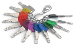
Der Schlüssel mit Largekey-Clip ist ebenfalls in 12 Farben verfügbar.