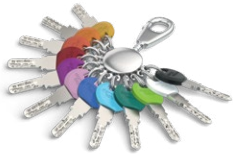
Für den Standardschlüssel gibt es Smartkey-Clips in 12 Farben.