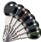
Bei den RFID-Transponder-Clips erleichtern 6 farbige Ring-elemente die Orientierung.