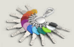
Smartkey Clips (SK)

Der Service-Schlüssel ist durch einen Code auf der Rückseite gekennzeichnet. Durch eine der 12 bunte Clipfarben ist der Schlüssel noch leichter zu identifizieren.