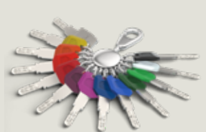
Largekey Clips (LK)