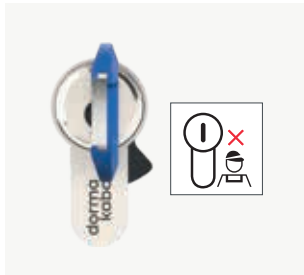
Schlüsselkanal in der normalen Stellung: 6 Uhr

In der normalen Schlüsselabzugsstellung kann der Schließzylinder von außen nur mit dem Inhaber-Schlüssel betätigt werden.