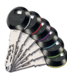
Bei den RFID-Transponder-Clips erleichtern 6 farbige Ring-elemente die Orientierung.