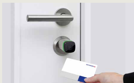
dormakaba cilindro digitale