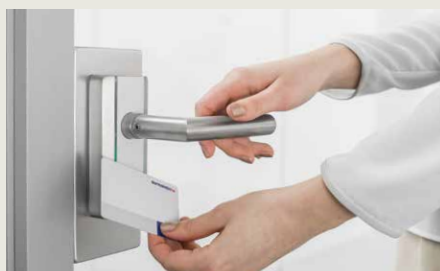
dormakaba c-lever compact