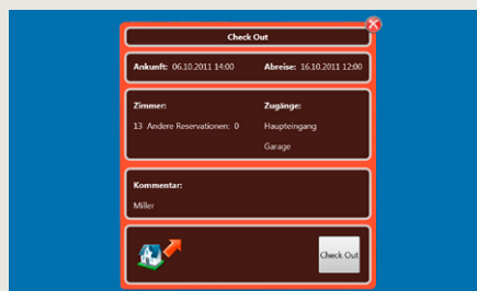
Modalità CheckOut: un semplice click è sufficiente per annullare la programmazione delle tessere.