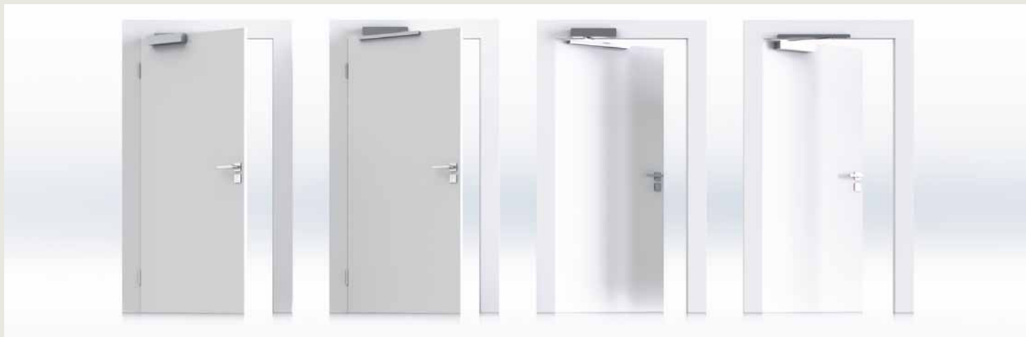
1. Montage sur l'ouvrant côté paumelle