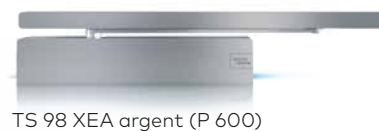
TS 98 XEA argent (P 600)

dormakaba Belgium N.V. | Lieven Bauwensstraat 21a | BE-8200 Brugge | T +32 50 45 15 70 | info.be@dormakaba.com | www.dormakaba.be dormakaba France | 2-4 rue des Sarazins | FR-94046 Créteil cedex | T +33 141 94 24 00 | marketing.fr@dormakaba.com | www.dormakaba.fr dormakaba Luxembourg S.A. | Duchscherstrooss 50 | LU-6868 Wecker | T +352 26710870 | info.lu@dormakaba.com | www.dormakaba.lu dormakaba Suisse SA | Route de Prilly 21 | CH-1023 Crissier | T +41 848 85 86 87 | info.ch@dormakaba.com | www.dormakaba.ch